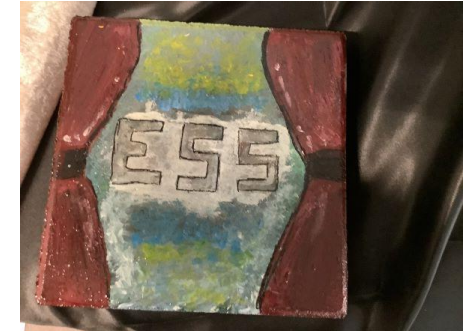
Vorhang auf, ESS!